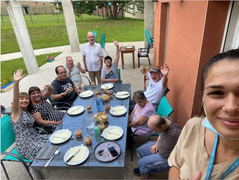
Pour le 11 juillet, nous avons fait appel à la cuisine qui nous a fourni les saucisses.