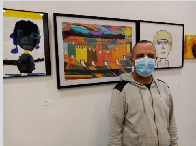
Une photo de moi pour garder un souvenir