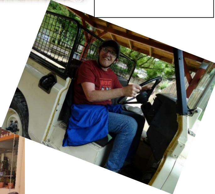
En route, Messieurs Dames